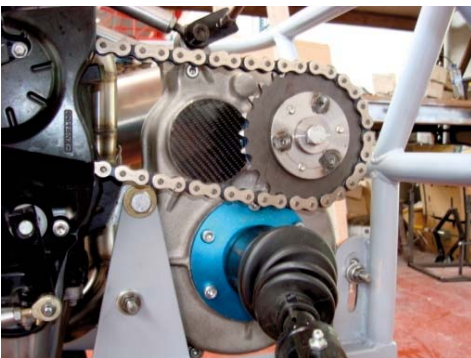
PONT MARCHE ARRIERE