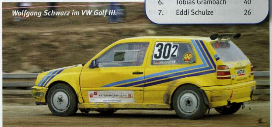
Wolfgang Schwarz im VW Golf III.