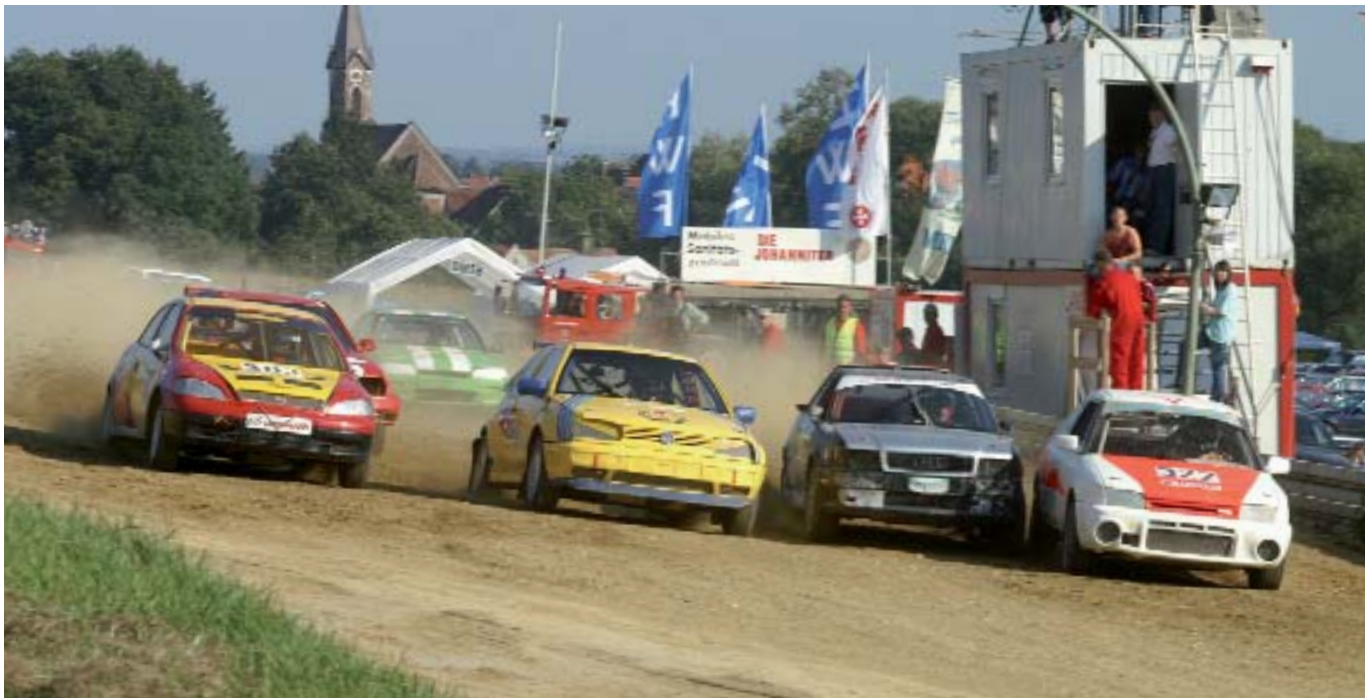
▲ Los geht's: Start der Autocross-Supertourenwagen auf dem Kesseltal Ring in Brachstadt.

Autocross hat in Deutschland eine lange Tradition. Bereits seit den 60er Jahren wird die spektakuläre Vierrad-Disziplin im Gelände ausgetragen. Auch die kommende Saison verspricht Spannung. Erneut stehen zehn Rennen zur Deutschen Autocross-Meisterschaft im Kalender. Los geht's am zweiten Wochenende im April. Saisonauftakt ist auf dem Ewald-Pauli-Ring in Schlüchtern. In diesem Jahr fahren die Autocross-Piloten das erste Mal ein Rennen im benachbarten Frankreich: auf dem Circuit Soleil in Steinbourg unweit von Straßburg. Als Veranstalter zeichnet der RCC Münster verantwortlich, der über keine eigene Strecke verfügt.